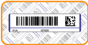
Cryogenic barcode label: 60mm x 15mm. Kosten: 0,11 €