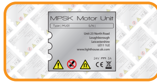
Zilver / Grijs Polyester label: 45mm x 45mm. Kosten: 0,23 €