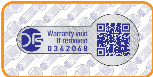
Garantie, VOID label: 70mm x 30mm. Kosten: 0,38 €