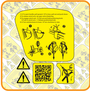
Labelset in geel polyester: 100mm x 125mm. Kosten: 0,95 €