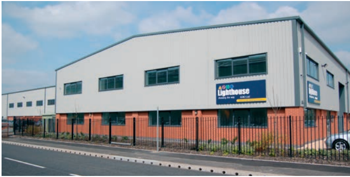
Lighthouse (UK) Ltd. Verkoop, ondersteuningskantoor en materiaal fabriek