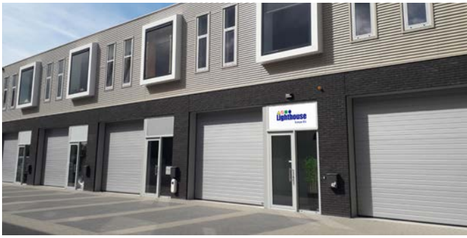
Lighthouse Europe B.V. Verkoop- en ondersteuningskantoor