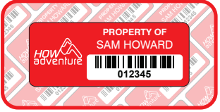
Destructible inventarislabel: 50mm x 20mm. Kosten 0.20 €