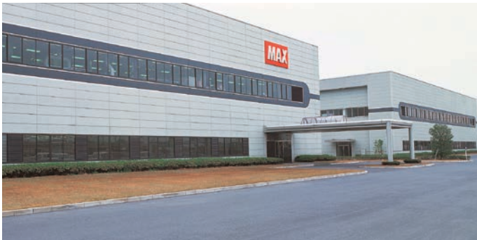
Boven: de fabriek van Max Co in Tamamura (Japan), waar onze CPM-hardware wordt gemaakt.