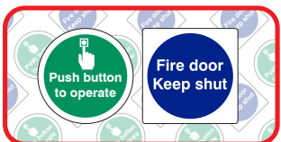
Veiligheidslabel: 80mm x 80mm Kosten: 0.51 €