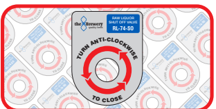
Maatwerk TPM-label: 75mm x 100mm. Kosten: 0.88€