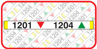
Stellinglabel: 490mm x 45mm Kosten: 2.72 €